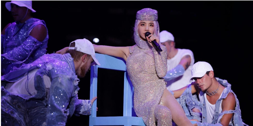
蔡依林选择森海塞尔 Digital 6000 在舞台上大放异彩

流行天后蔡依林以其独特迷人的嗓音和充满魅力的舞台表现力征服了无数观众的心。2019 年至 2023 年间，蔡依林 Ugly Beauty 世界巡回演唱会吸引了全球观众的目光。这场巡演以她的第 14 张录音室专辑《Ugly Beauty》命名，在 2019 年金曲奖上获得了七个奖项的提名，并赢得了两项大奖。蔡依林选择 Digital 6000 麦克风系统为粉丝呈现了一场精彩绝伦的听觉盛宴，整场演出充满了熟悉的旋律、炫目的服装和热力四射的舞步。